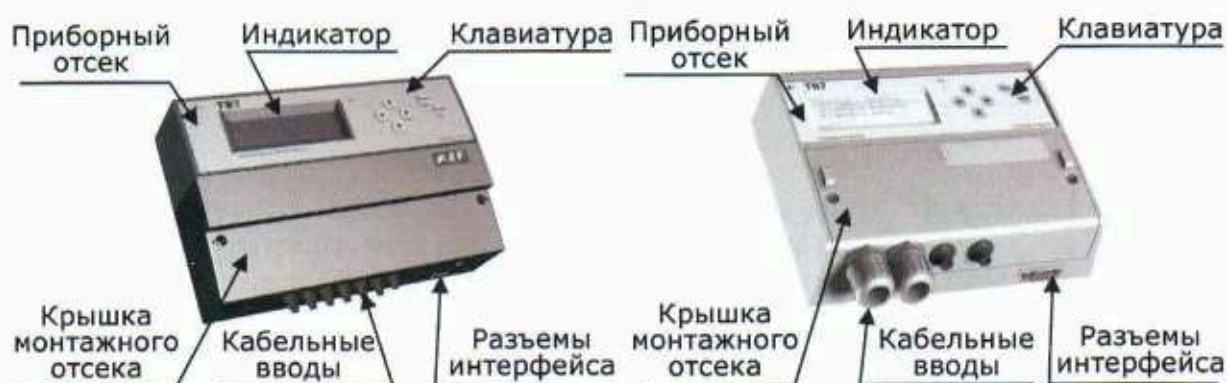
Рисунок 1 – Внешний вид тепловычислителя

Внешний вид тепловычислителя (два конструктивных решения) приведен на рисунке 1.