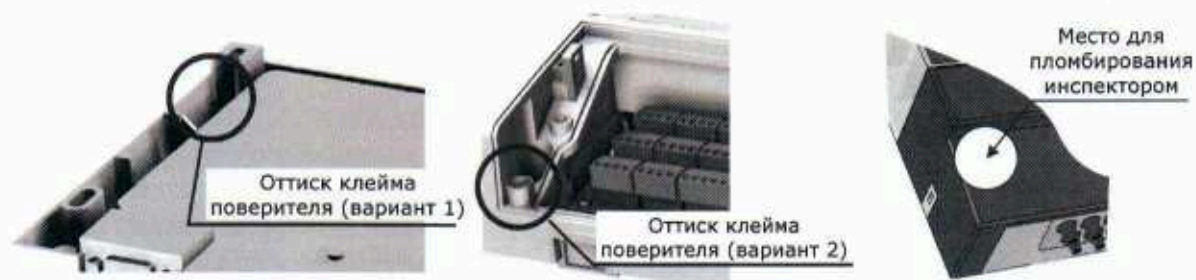
Рисунок 3 – Места пломбирования тепловычислителя