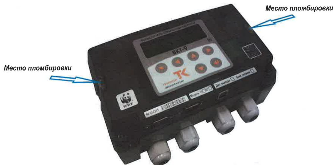
Рисунок 1 – Внешний вид вычислителя

Внешний вид вычислителя приведен на рисунке 1.