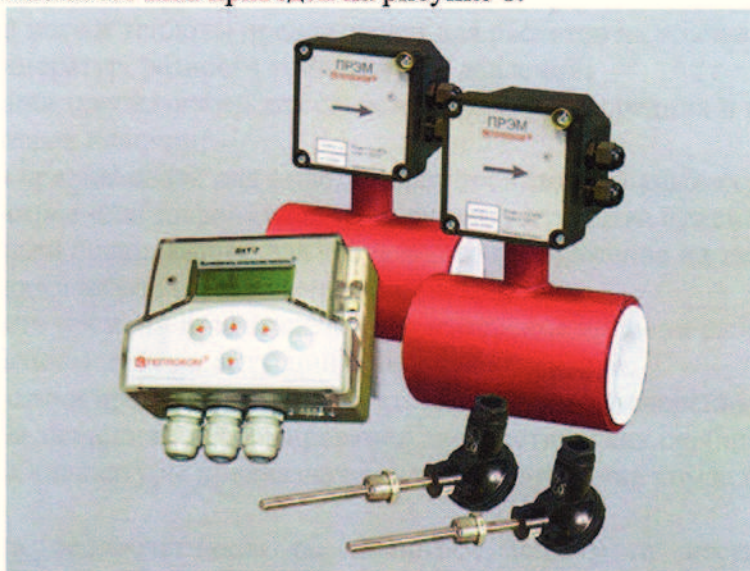
Рисунок 1 – Внешний вид теплосчетчика

Внешний вид теплосчетчика приведен на рисунке 1.